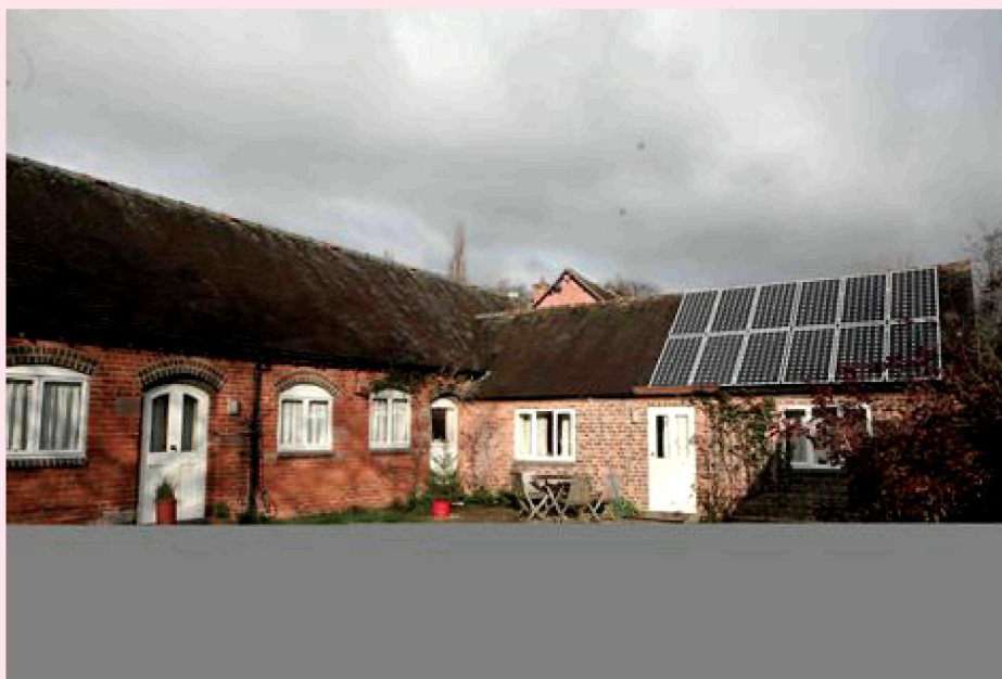
Рисунок 2. Пример фактического результата практического применения LLL

Говоря о фактическом результате практического применения LLL на Западе, можно привести пример (case study) установки солнечных панелей и улучшения теплоизоляционных свойств стен и крыши в перестроенном под жилое помещение бывшем хлеве (рис. 2). Хозяева (глубокие пенсионеры – муж и жена около 80 лет) на мой вопрос о том, почему они это сделали (сроки окупаемости примерно 10 лет), ответили так: когда они обратились по электронной почте за консультацией (что можно сделать в их доме) в энергосервисную компанию, к ним приехали и провели обследование (энергоаудит) их дома,